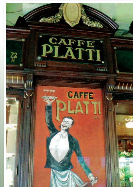
Décor du Café Platti

Ces cafés dits "historiques" ont la particularité d'être aussi des pâtisseries voire des chocolateries. On y boit un espresso (le meilleur au monde !), un vermouth (apéritif inventé à Turin par Carpano en 1786) avec des petits sandwiches raffinés ; on y déjeune sur le pouce, on déguste un bicérin , un gâteau au chocolat ou une poignée de giandujotti ... Partout, le chocolat chaud, servi à la tasse avec ou sans crème fouettée, est épais et puissant en goût. La recette traditionnelle d'un chocolat noir fondu dans de l'eau flatte les papilles. Le verre d'eau fraîche est toujours servi pour en fixer le souvenir. Ces cafés sont des lieux de plaisir, de gourmandise et de convivialité.