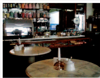
Intérieur d'époque du Café "Le Bicerin"

Rentrant d'un séjour à la cour d'Espagne, le duc Emmanuel-Philibert de Savoie apporte les premières fèves de cacao dans le Piémont quand il en prend possession en 1559. Cuisiniers et pâtisseries de la cour savent alors l'utiliser. C'est un marchand florentin de retour du Mexique en 1606, Francesco Carletti, qui rapporte en Italie la mode du chocolat à boire initiée là-bas par les colons espagnols. Sa recette assemble alors du cacao, du sucre, de la vanille et de la cannelle. Mais l'aristocratie italienne expérimente des alliances plus rares : cédrat ou citron, musc ou ambre gris, jasmin... En 1678, Giò Antonio Ari est le premier cioccolatiere (chocolatier) : il vend à Turin du ciòlata en tasse. Dès lors, la ville devient la capitale du chocolat, renommée qu'elle garde encore aujourd'hui, produisant à elle seule 40 % de la production nationale. La fin du XVIII e siècle a uni pour le meilleur le café, le chocolat et la crème dans le bicérin . Au XIX e siècle se développent les cafés, dans lesquels se réunissent les frondeurs qui soutiennent l'indépendance. Le café et le chocolat sont alors des boissons populaires. Le chocolat s'installera dans la confiserie italienne au XX e