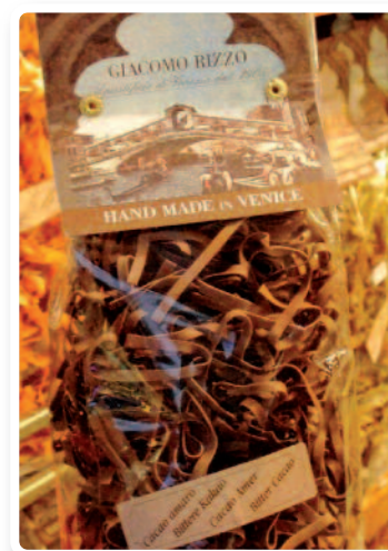
Pâtes au cacao

Comme au temps des Aztèques, le cacao est utilisé comme épice dans la cuisine de la Renaissance italienne. Ragoûts et pâtes se teintent alors de noir et sont les seuls en Europe à être préparés ainsi. L'Italie a conservé depuis le XVIII e siècle la coutume d'utiliser le cacao dans la cuisine, souvent dans les plats de pâtes ou de viande. On préparait alors des lasagnes aux amandes, aux anchois, aux noix et au chocolat.