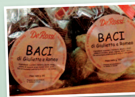
Biscuits "Les Baisers de Juliette et Roméo"

Dans la région du Biellais (autour de la ville de Biella au nord de Turin), le palpitum est une tarte à base de poires et de chocolat vendue dans les pâtisseries. Tandis que les canestrelli , gaufrettes parfumées au chocolat et aux noisettes, sont beaucoup plus populaires. Les boulangeries et pâtisseries de Crevacuore préparent toutefois encore des canestrej artisanaux, séchés entre les mâchoires d'un fer à gaufre, selon la tradition du XVII e siècle.