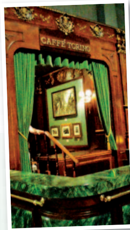
Décor du Café Torino

Caffè Reale Goûters royaux avec assortiment de gâteaux secs... à tremper dans un chocolat chaud bien sûr.