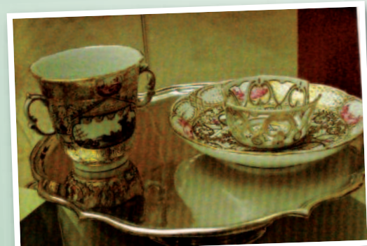
Tasse trembleuse à chocolat en porcelaine de Meissen (XVIII e )