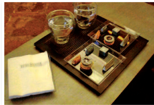
Plateau de dégustation chez Gobino