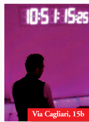
Salle de dégustation où le temps ralentit...