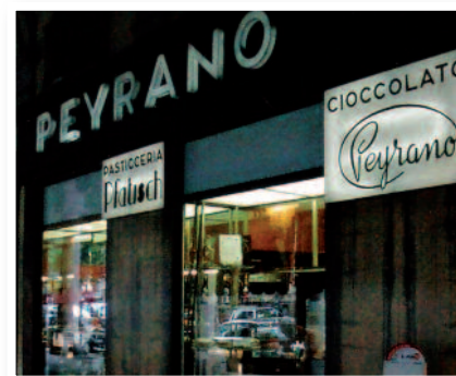
Façade de la chocolaterie Peyrano

Les boutiques de confiseurs, pâtisseries et liquoristes témoignent d'un raffinement qui s'est longtemps inspiré de la France toute proche. A l'intérieur, de grands miroirs multiplient à l'infini l'image des pots regorgeant de confiseries et de chocolats toujours emballés.