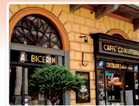
Facade du Café "Le Bicerin"

Piazza della Consolata, 5 www.bicerin.it