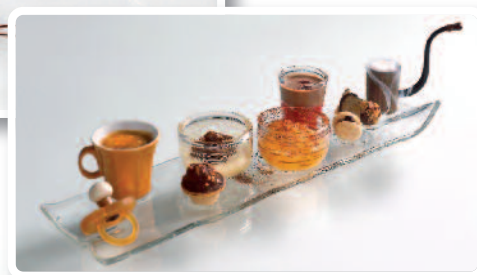
"Low Il Giocoladele"

la dégustation. Imaginez un escalier ( scala en Italien) prenant la place de votre assiette : sur chaque marche, deux bouchées, bonbons ou mini verrines déclinant le chocolat sous toutes ses formes et couleurs, et dans ses diverses associations (fruit, épice, café...). Cette montée initiatique des saveurs aboutit à l'ultime marche qui cache son secret : la fève de cacao originelle enveloppée de ces quelques mots à déplier :