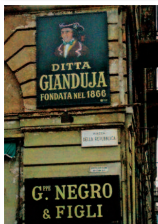
Plaque de rue pour un Gianduja

Symbole gourmand de la ville, les giandujotti ont une forme unique de petit lingot trapézoïdal (ou de barque renversée, selon l'interprétation !). Le gianduja est un praliné fondant à base de poudre de noisettes du Piémont. Les recettes peuvent aussi contenir, au gré de la créativité des chocolatiers, des noix ou des amandes finement broyées. Les giandujotti sont enveloppés dans un papier doré ou argenté.