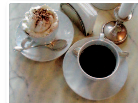
Le Bicerin tel qu'on le sert dans ce café historique