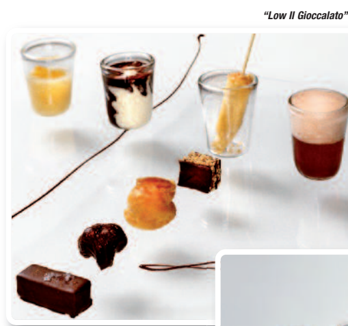
"Low Il Giocolato"

Son dessert appelé simplement "Il giocolato 2008" est un chef d'œuvre de créativité, tant dans la présentation que dans la philosophie de