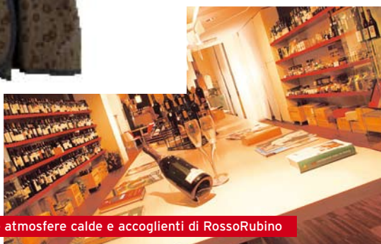
Le atmosfere calde e accoglienti di RossoRubino