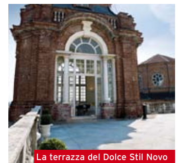
La terrazza del Dolce Stil Novo