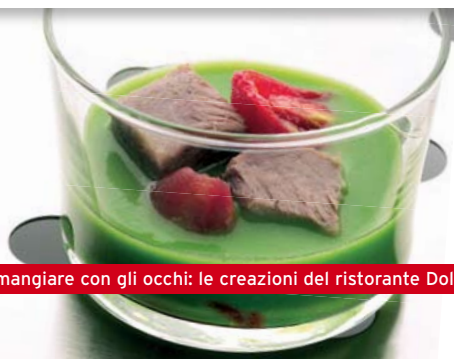
Da mangiare con gli occhi: le creazioni del ristorante Dolce Stil Novo

L'Art Hotel Boston ( www.arthotelboston.it ) ne è un perfetto esempio. Un luogo intimo ed esclusivo in cui convivono accoglienza e cura dei dettagli, un nuovo concetto d'ospitalità per questo albergo-museo situato all'interno di una palazzina liberty. Tutti gli ambienti sono caratterizzati dalla presenza di un intervento creativo o di opere di alcuni fra i più importanti artisti contemporanei, tra cui Boetti, Castellani, Fontana, Mondino e Warhol. Ogni camera è un mondo a sé: dallo stile marocchino per gli spiriti romantici agli ambienti zen, fino a quelli ispirati al mondo del caffè. Un vero gioiello è la camera