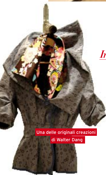
Una delle originali creazioni di Walter Dang